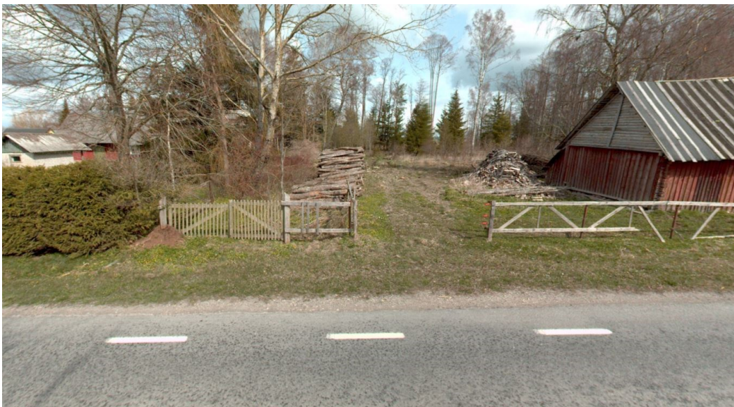
Joonis 3. Vaade riigitee km 32,98 ristumiskohale, pildistamise kuupäev 28.04.2022