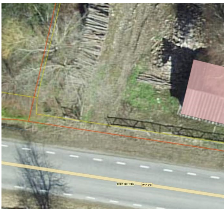
Joonis 4. Side maakaabli asukoht (punane joon, kollasega katastriüksuste piirid), väljavõte Maa-ameti geoportaalist

Tulenevalt sellest, et riigitee ristumiskohas asub riigitee alusel maaüksusel side maakaabel (omanik Telia Eesti AS, Joonis 4) tuleb ristumiskoha rekonstrueerimise kooskõlastada ka maakaabli omanikuga. Selleks palume huvitatud isikul taotleda maakaabli omaniku kirjalik kooskõlastus riigitee ristumiskoha ehitamise näidislahendusele (Lisad 3 ja 4). Kooskõlastus koos vabas vormis koostatud ning digitaalselt allkirjastatud riigitee ristumiskoha ehitamise avaldusega saata meile maantee@transpordiamet.ee . Ristumiskoha ehitamise avalduse peab allkirjastama huvitatud isik (volituse alusel tegutsedes tuleb avaldusele lisada ka vabas vormis digitaalselt allkirjastatud volitus). Riigitee ristumiskoha ehitamise lepingu sõlmimisega täiendavaid kulusid (riigilõiv) ei kaasne. Kõik riigitee ristumiskoha ehitamisega seotud kulud kannab huvitatud isik.