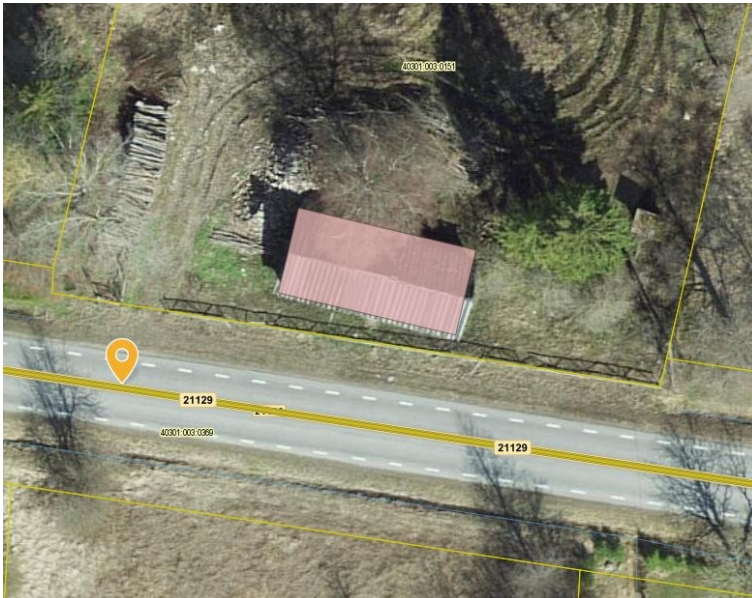
Joonis 1. Riigitee ca km 32,98 olemasolev ristumiskoht, väljavõte Maa-ameti geoportaalist, ülelend 16.04.2022